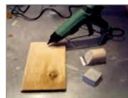
Tuote on valmis jatkokäsittelyä varten.