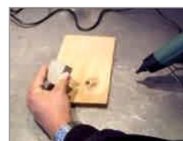
Aseta viilennysrauta sulan oksantäytemassan päälle.