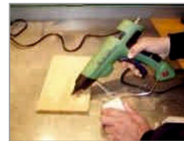
Täytä vaurioitunut kohta oksantäytemassalla