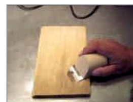
Poista ylimääräinen osa siklillä.